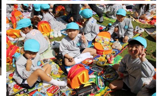
素晴らしい天気の中、東山動物園に行ってきました。 いろいろな動物を見ました。そして、お母さんの手作りのお弁当を頂きました！