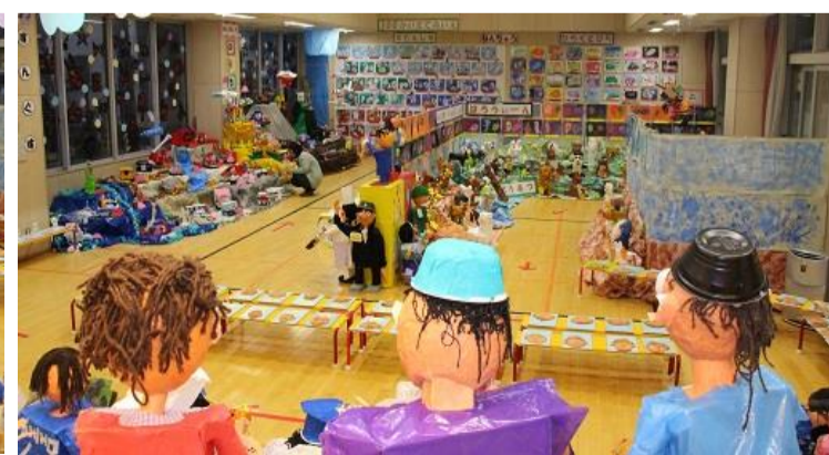
園児のみなさんが一生懸命作品を作りました。その作品を先生が一つ一つ丁寧に展示しました。