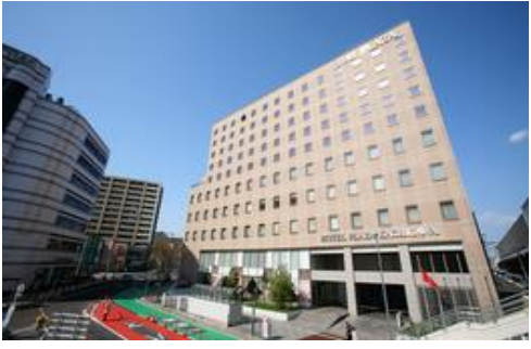
ホテルプラザ勝川